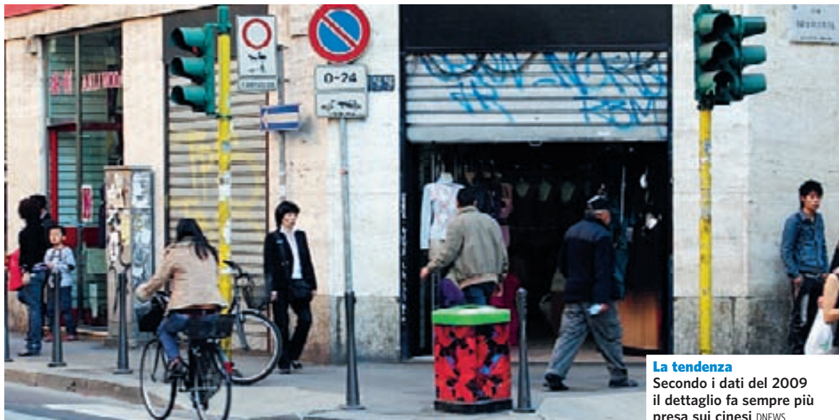
La tendenza Secondo i dati del 2009 il dettaglio fa sempre più presa sui cinesi DNEWS

Sesto San Giovanni Multe AGGREDITA DA DUE UOMINI SUL PORTONE _P.8 CON UNA CURIOSA TESI DIFENSIVA NON PAGA _P.8